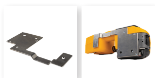
■ Piastra di protezione Per l'uso su superfici abrasive