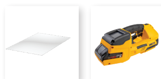
■ Película protectora de pantalla Per una protezione aggiuntiva negli ambienti più ostili